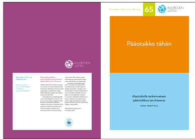
Värejä käytetään pintoina tuomaan ilmettä ja selkeyttämään sisällön jakoa.