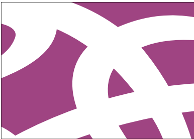
Tunnuskuviota voi käyttää rajattuna värillisellä pinnalla.

Kuurojen Liiton visuaalinen kieli rakentuu tunnuksen merkkiosan vahvasta läsnäolosta, väripinnoista ja laadukkaista valokuvista.